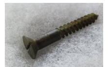
お土産に持ち帰った「ネジ」