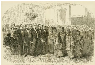
ホワイトハウスでブキャナン大統領に批准書を渡す遣米使節団の様子を報じる当時のアメリカの新聞