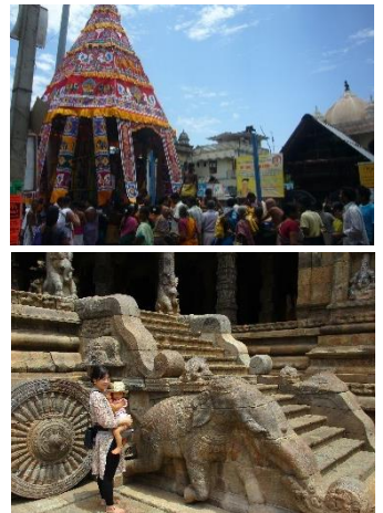
上:南インドの山車祭り 下:南インドの寺院遺跡にて

はとても残念ですが、自由にフィールドワークができる日が早く戻ってくることを願いつつ、これを機に群馬県内での異文化理解や多文化共生について何か調査研究ができないかと模索しているところです。